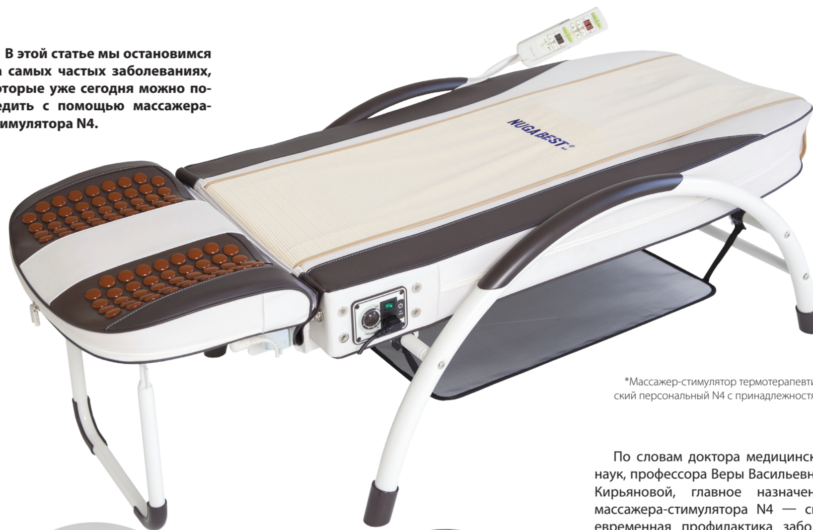
*Массажер-стимулятор термотерапевтический персональный N4 с принадлежностями.

В этой статье мы остановимся на самых частых заболеваниях, которые уже сегодня можно победить с помощью массажера-стимулятора N4.